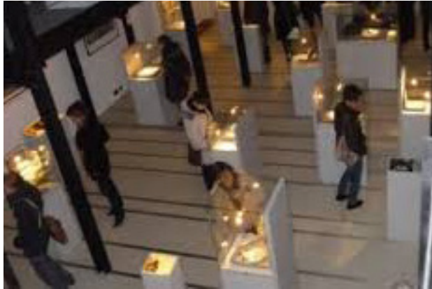
Ehemalige Synagoge Haigerloch

Die ehemalige Synagoge Haigerloch steht heute mit der Dauerausstellung „Spurensicherung: Jüdisches Leben in Hohenzollern“ – gestaltet vom Haus der Geschichte Baden-Württemberg – für Besucherinnen und Besucher ganzjährig offen.