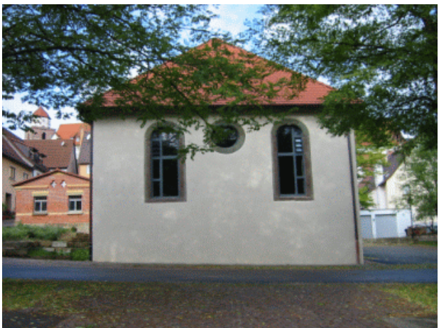
Ehemalige Synagoge Haigerloch

Tel: 07474/2261 Fax: 07474/51446 E-Mail: synagoge-haigerloch@web.de